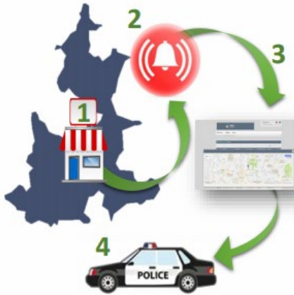
Ciclo de funcionamiento del Botón de Alertamiento