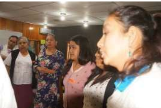
Participando en las propuestas

Nombre de la actividad: Propuestas para las líneas de acción Fecha de realización: 27 de noviembre de 2019. Responsable de la actividad: Corporativo de Soluciones Integrales Ruiz Ramírez, S.C. Descripción de la actividad: La facilitadora pregunta a las participantes, cuáles serán los pasos clave-estratégicos que permitan avanzar hacia: a) el cuidado preventivo de la violencia a las mujeres. b) A la prevención y atención en casos de abuso sexual. c) Acompañamiento a la embarazada y el abordaje de la prevención de la violencia. Mediante preguntas detonantes la facilitadora escribe las respuestas en los rotafolios. La traducción es importante porque es más lenta la actividad. Objetivo: Obtener propuestas de mejora para la atención de mujeres víctimas de violencia que se presenten en los módulos y hospital de tal manera que se cumpla con la normatividad.