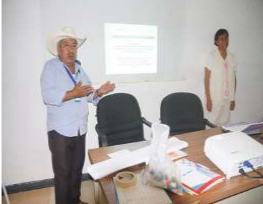
Bienvenida en totonaco

Objetivo: Dar a conocer el proyecto y transparentar las acciones realizadas por las dependencias, programas y proyectos.