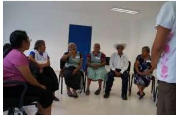
Escuchando la bienvenida y presentación del proyecto