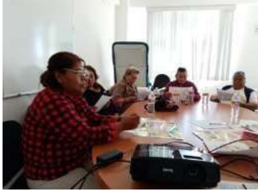
Diciendo su emoción

Objetivo: evaluar las horas de trabajo con las parteras y establecer trabajo de continuidad en el próximo año