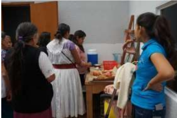
Coffee y convivio

Objetivo: evaluar las horas de trabajo con las parteras y establecer trabajo de continuidad en el próximo año