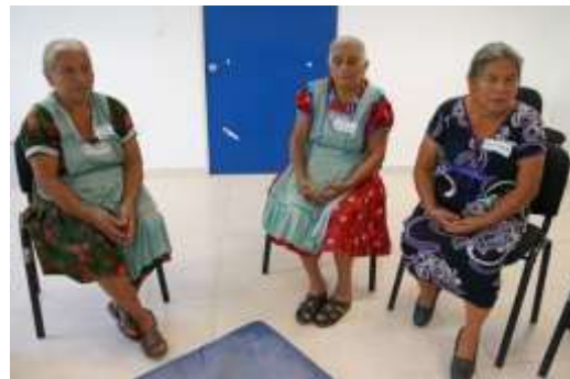
Participando en las propuestas