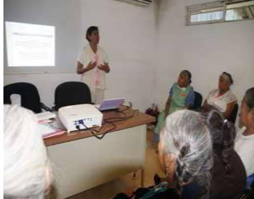
Bienvenida en Español