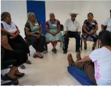
Explicando la violencia

Nombre de la actividad: Violencia institucional, violencia de género y sexual. NOM046 Fecha de realización: 28 de noviembre de 2019. Responsable de la actividad: Corporativo de Soluciones Integrales Ruiz Ramírez, S.C. Descripción de la actividad: Mediante una presentación la facilitadora presenta el tema de violencia de género, los tipos de violencia haciendo hincapié en la violencia sexual e institucional. Presentar la NOM46 de la SSA que rige con relación a la violencia de género y sexual hacia las mujeres Objetivo: Recuerdan y refuerzan lo que es la violencia, los tipos de violencia y el círculo de la violencia para utilizarlas cuando se presente en mujeres que asisten a los módulos o al hospital de Tlaola