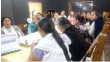
Revisando el género

Nombre de la actividad: Repaso de sexo, género, perspectiva de género Fecha de realización: 27 de noviembre de 2019. Responsable de la actividad: Corporativo de Soluciones Integrales Ruiz Ramírez, S.C. Descripción de la actividad: mediante el interactivo del INMUJERES se refuerza la diferencia entre sexo, género y se fortalece la perspectiva de género. Objetivo: Reforzar los temas con las parteras, para que los incorporen en sus actividades diarias para la atención de mujeres embarazadas, en parto y puerperio.