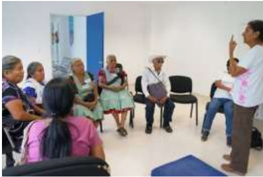
Presentación del proyecto

Objetivo: Dar a conocer el proyecto y transparentar las acciones realizadas por las dependencias, programas y proyectos.