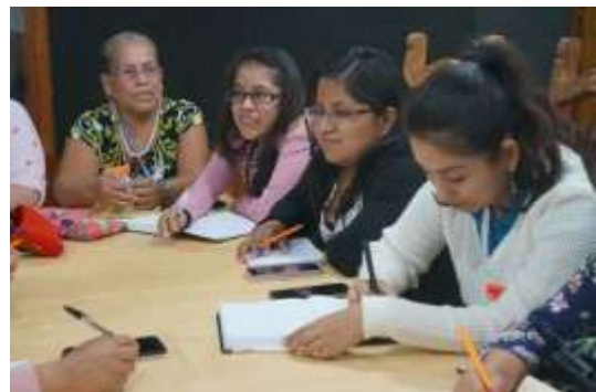
Participando en las propuestas