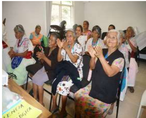
Finalizando la mesa