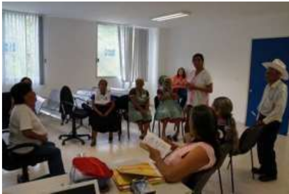
Explicando el objetivo

Nombre de la actividad: Objetivo de la mesa Fecha de realización: 28 de noviembre de 2019. Responsable de la actividad: Corporativo de Soluciones Integrales Ruiz Ramírez, S.C. Descripción de la actividad: Presentación del objetivo de la mesa de trabajo con una presentación PPT Objetivo: Las parteras se fortalecen en los temas de atención humanitaria, comunicación asertiva (sin violenta) perspectiva de género y la NOM046 para lograr partos confiables, seguros y que cada vez menos mujeres tengan complicaciones relacionadas con maltrato.