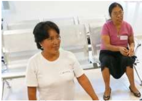
Diciendo su emoción

Objetivo: evaluar las horas de trabajo con las parteras y establecer trabajo de continuidad en el próximo año