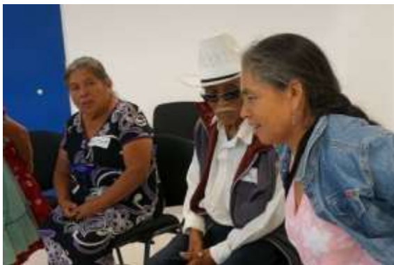
Revisando el género

Nombre de la actividad: Repaso de sexo, género, perspectiva de género Fecha de realización: 28 de noviembre de 2019. Responsable de la actividad: Corporativo de Soluciones Integrales Ruiz Ramírez, S.C. Descripción de la actividad: mediante el interactivo del INMUJERES se refuerza la diferencia entre sexo, género y se fortalece la perspectiva de género. Objetivo: Reforzar los temas con las parteras, para que los incorporen en sus actividades diarias para la atención de mujeres embarazadas, en parto y puerperio.