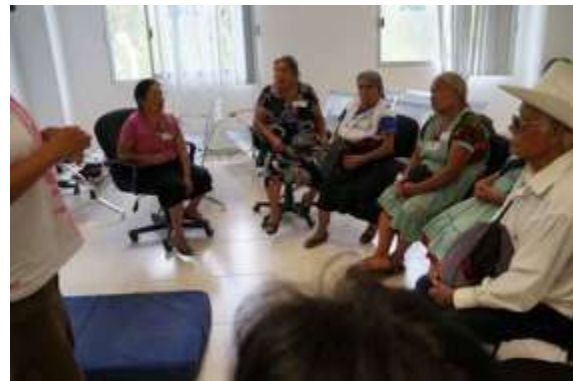
Traducción al náhuatl