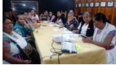
Revisando la perspectiva de género