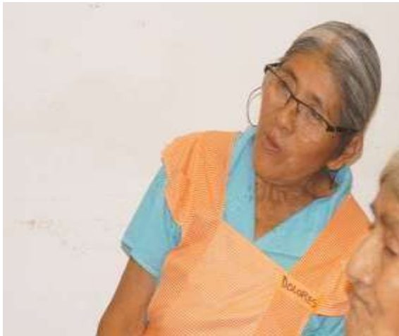
Diciendo su emoción

Objetivo: Obtener propuestas de mejora para la atención de mujeres víctimas de violencia que se presenten en los módulos y hospital de tal manera que se cumpla con la normatividad.