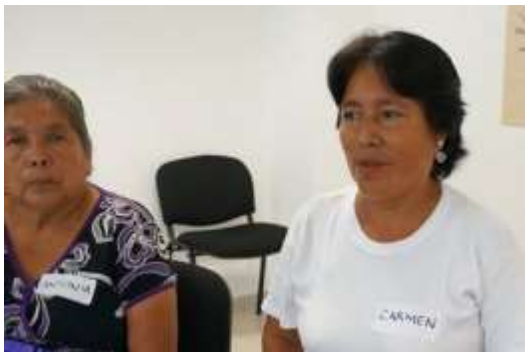
Participando en las propuestas

Nombre de la actividad: Propuestas para las líneas de acción Fecha de realización: 28 de noviembre de 2019. Responsable de la actividad: Corporativo de Soluciones Integrales Ruiz Ramírez, S.C. Descripción de la actividad: La facilitadora pregunta a las participantes, cuáles serán los pasos clave-estratégicos que permitan avanzar hacia: a) el cuidado preventivo de la violencia a las mujeres. b) A la prevención y atención en casos de abuso sexual. c) Acompañamiento a la embarazada y el abordaje de la prevención de la violencia. Mediante preguntas detonantes la facilitadora escribe las respuestas en los rotafolios. La traducción es importante porque es más lenta la actividad. Objetivo: Obtener propuestas de mejora para la atención de mujeres víctimas de violencia que se presenten en los módulos y hospital de tal manera que se cumpla con la normatividad.