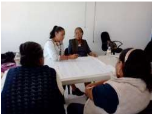
Participando en las propuestas

Nombre de la actividad: Propuestas para las líneas de acción Fecha de realización: 28 de noviembre de 2019. Responsable de la actividad: Corporativo de Soluciones Integrales Ruiz Ramírez, S.C. Descripción de la actividad: La facilitadora pregunta a las participantes, cuáles serán los pasos clave-estratégicos que permitan avanzar hacia: a) el cuidado preventivo de la violencia a las mujeres. b) A la prevención y atención en casos de abuso sexual. c) Acompañamiento a la embarazada y el abordaje de la prevención de la violencia. Mediante preguntas detonantes la facilitadora escribe las respuestas en los rotafolios. La traducción es importante porque es más lenta la actividad. Objetivo: Obtener propuestas de mejora para la atención de mujeres víctimas de violencia que se presenten en los módulos y hospital de tal manera que se cumpla con la normatividad.