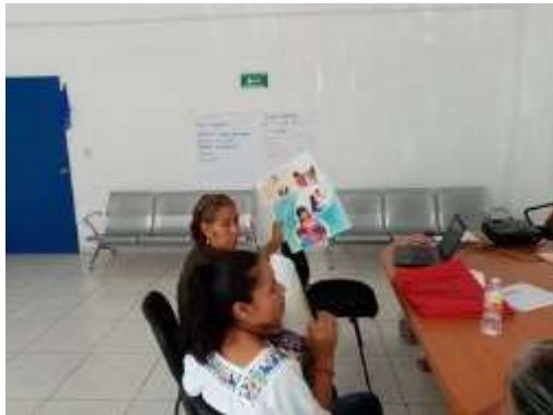
Explicando la violencia

Objetivo: Recuerdan y refuerzan lo que es la violencia, los tipos de violencia y el círculo de la violencia para utilizarlas cuando se presente en mujeres que asisten a los módulos o al hospital de Cuetzalan