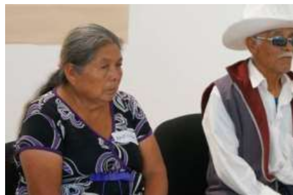
Revisando la perspectiva de género