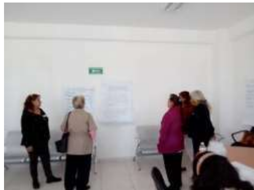
Participando en las propuestas