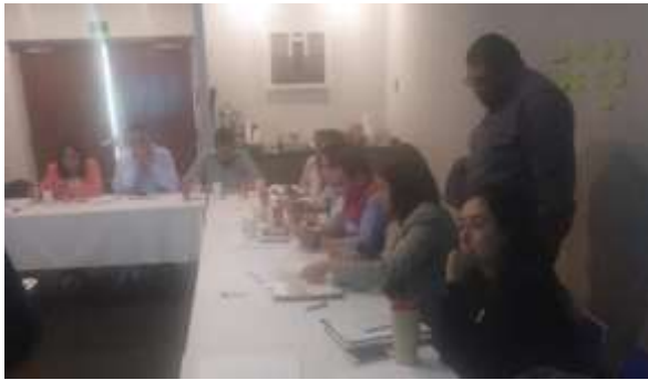
Fotografía 1 Anotando y pegando sus expectativas

Que los participantes se conozcan e identifiquen sus instituciones, así como clarificar expectativas y hacerlos conscientes de las actitudes que están dispuestas a aportar para un buen curso.