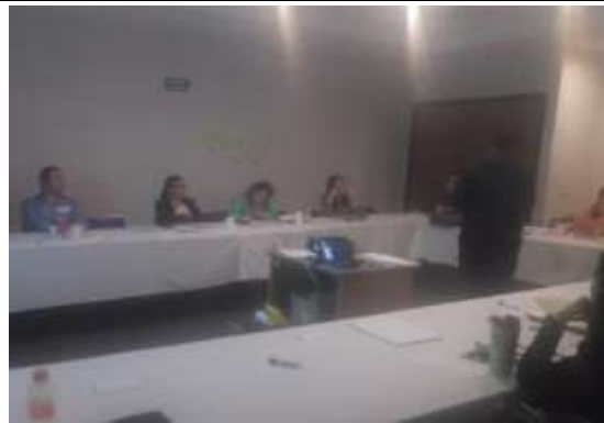
Fotografía 2 Propiciando las respuestas de participación