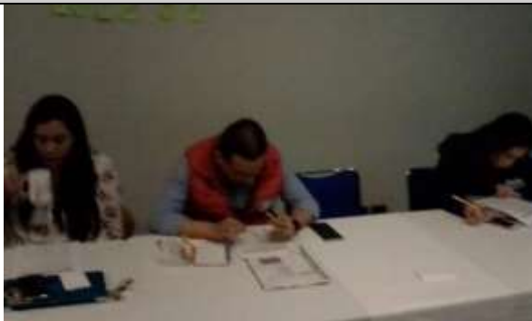
Fotografía 1 Retroalimentación de resultados obtenidos

Que las y los participantes reconozcan el nivel de conocimientos clave que poseen de los temas del curso antes de que sean revisados, así como posteriormente al finalizar el curso se identifique el nivel de asimilación de los temas con una nueva aplicación de una evaluación final.