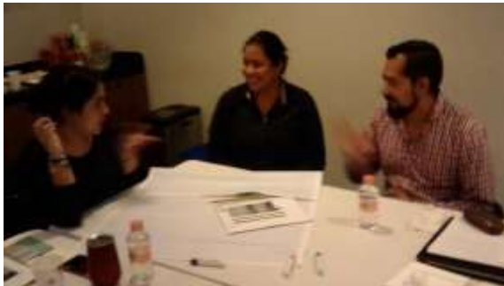
Fotografía 1 Preparando sus carteles en equipos.

Que las y los participantes generen ideas de solución a las problemáticas revisadas durante el curso y presenten propuestas o sugerencias a las que se comprometan a dar seguimiento posterior al mismo.