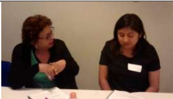
Fotografía 1 Comentando el artículo asignado

Que las y los participantes identifiquen datos actuales y diversas circunstancias y acciones gubernamentales relativas a los Derechos Sexuales y Reproductivos, así como la Violencia de Género.