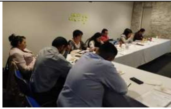
Fotografía 2 Incentivar en alcanzar mejores logros