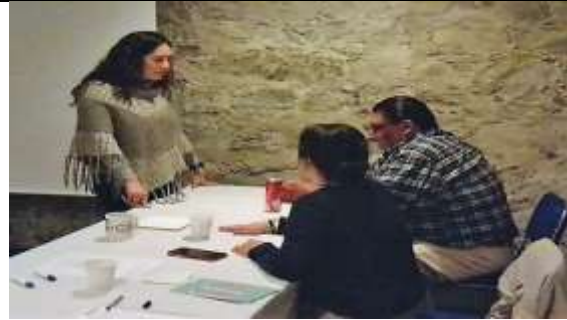
Fotografía 2 Comunicando a sus papás el embarazo