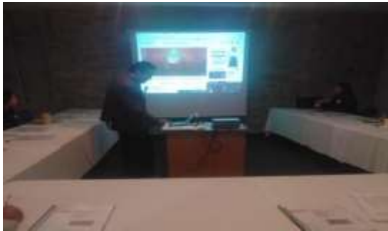
Fotografía 1 Preparando la proyección del video.

Que las y los participantes realicen un análisis de las diversas caras de la problemática de embarazos en adolescentes.