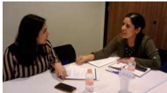
Fotografía 2 Identificando posturas personales