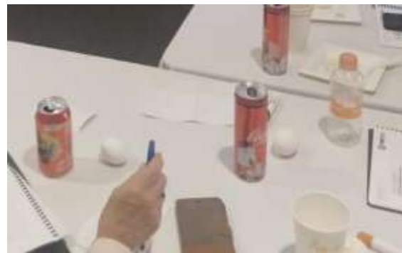
Fotografía 2 Identificación de implicaciones que conlleva el responsabilizarse de alguien.