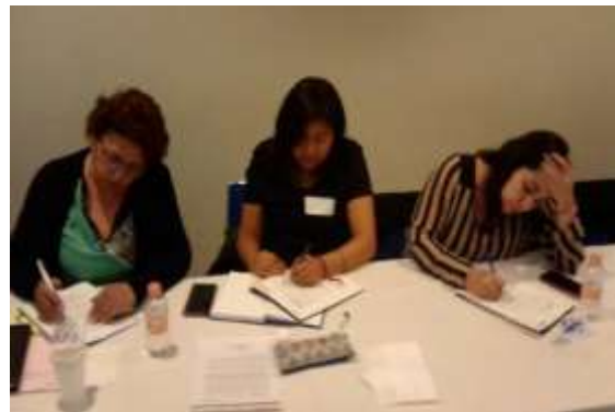
Fotografía 2 Incentivando la reflexión y análisis