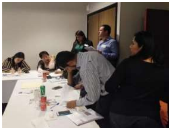
Fotografía 2 Intercambiando tarjetas