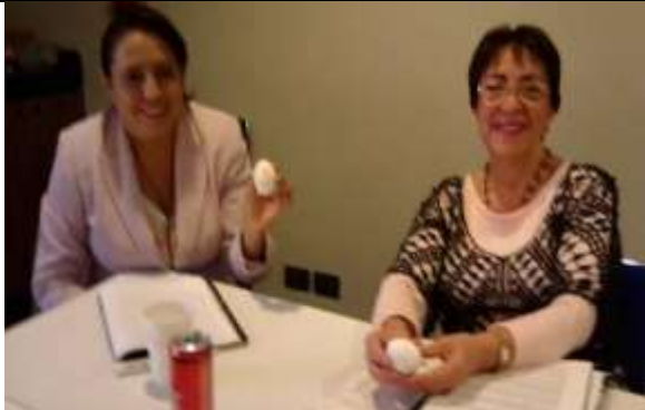
Fotografía 4 Dinámica Vivencial “Adopta un Huevo”

Que las y los participantes se sensibilicen a la experiencia de embarazarse sin planearlo y la responsabilidad que conlleva el cuidado de un ser dependiente.