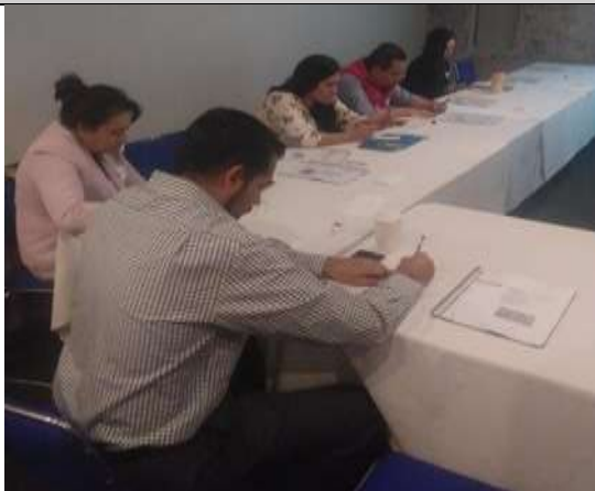
Fotografía 1 Los participantes preparando sus tarjetas

Que los participantes se sensibilicen sobre las bases afectivas que originan un embarazo en adolescentes.