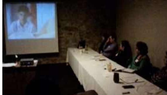
Fotografía 2 Proyección de Videos de Análisis.