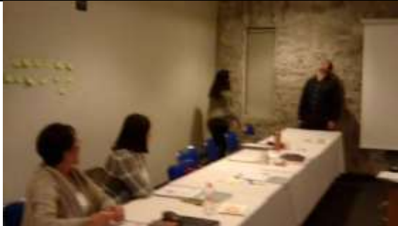
Fotografía 1 Escena inicial comunicando al novio

Que las y los participantes identifiquen las problemáticas que enfrenta una adolescente ante un embarazo involuntario y la importancia de que cuente con apoyo suficiente además de prevenirse dicho embarazo.