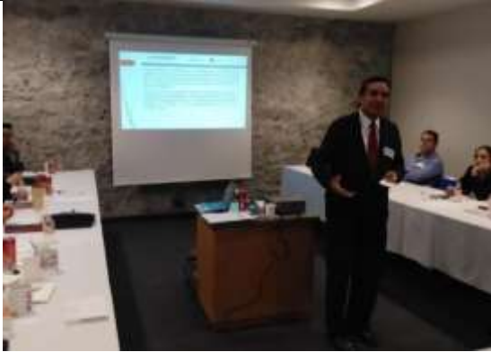
Fotografía 1 Planteamiento de las preguntas de debate

Que las y los participantes identifiquen las diversas posturas a favor y en contra de la perspectiva de género y que clarifiquen su visión acerca del papel del Estado ante este tema.