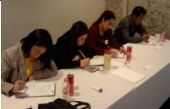
Fotografía 1 Iniciando respuesta de Cuestionarios

Que las y los participantes hagan una concientización personal de los temas para introducirlos en su análisis.