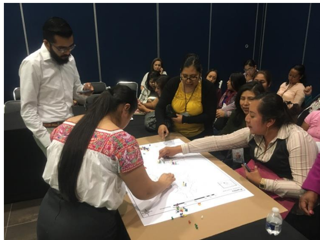
Fotografía 12. Salón 3 georreferenciando puntos.