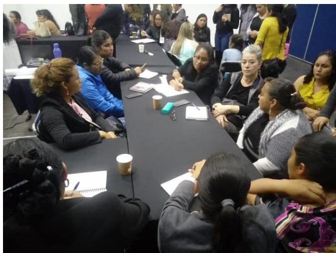
Fotografía 7. Salón 2 en Taller I