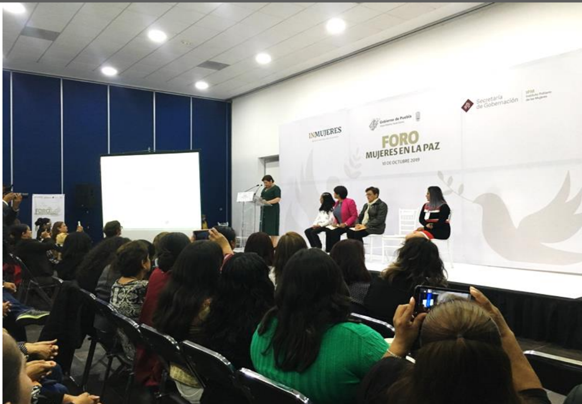
Fotografía 1. Panel de autoridades

"El Programa de Fortalecimiento a la Transversalidad de la Perspectiva de Género es público, ajeno a cualquier partido político. Queda prohibido el uso para fines distintos a los establecidos en el programa"