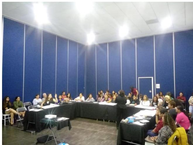
Fotografía 14. Explicación de programas federales en Salón 2