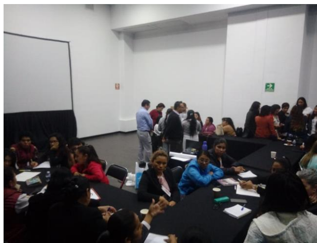
Fotografía 9. Salón 2 en Taller I