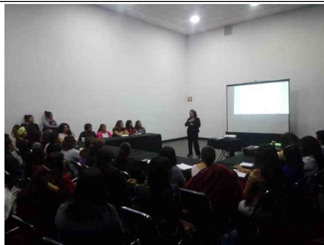
Fotografía 15. Tipos de subvenciones en Salón 3