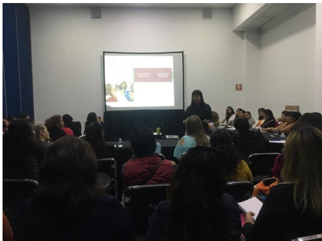
Fotografía 11. Salón 4 en mapeo participativo