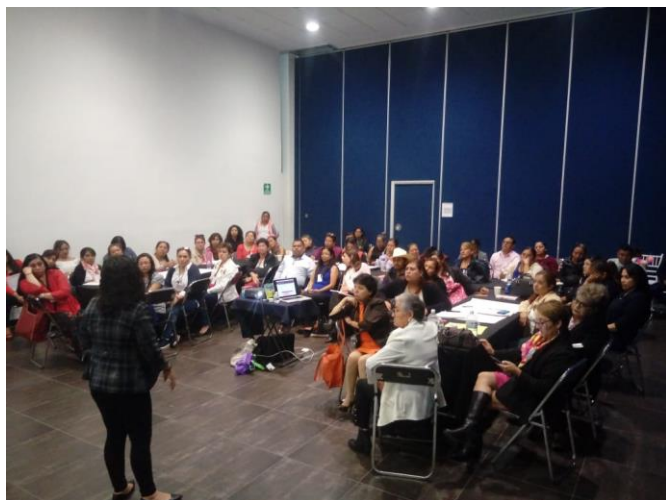
Fotografía 13. Explicación de programas federales en Salón 1

"El Programa de Fortalecimiento a la Transversalidad de la Perspectiva de Género es público, ajeno a cualquier partido político. Queda prohibido el uso para fines distintos a los establecidos en el programa"