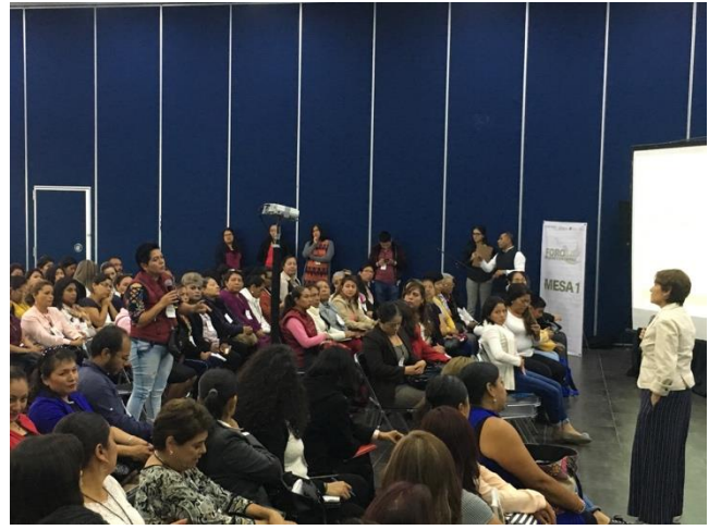
Fotografía 5. Ponencia magistral