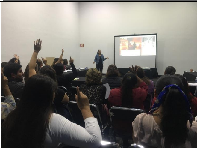
Fotografía 9. Salón 2 en definición de espacio público.

"El Programa de Fortalecimiento a la Transversalidad de la Perspectiva de Género es público, ajeno a cualquier partido político. Queda prohibido el uso para fines distintos a los establecidos en el programa"