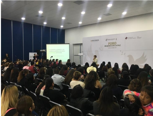
Fotografía 2. Ponencia magistral

"El Programa de Fortalecimiento a la Transversalidad de la Perspectiva de Género es público, ajeno a cualquier partido político. Queda prohibido el uso para fines distintos a los establecidos en el programa"