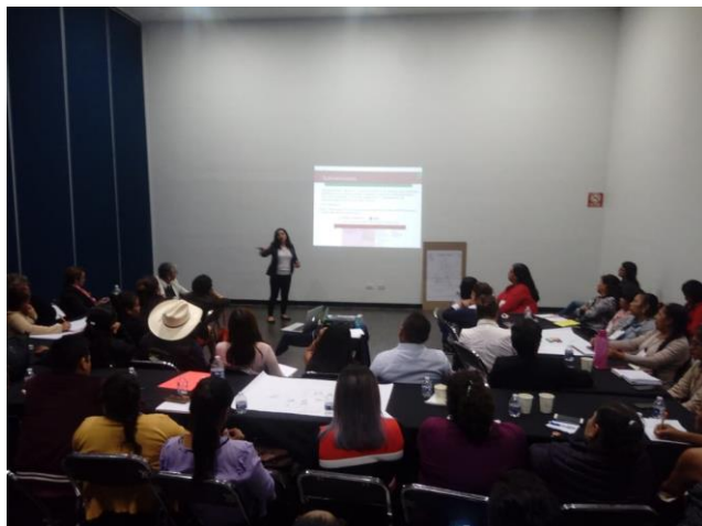
Fotografía 8. Salón 3 en Taller I