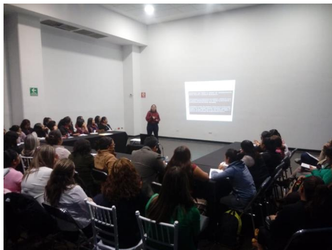
Fotografía 6. Salón 1 en Taller I

Fue interesante ver la interacción entre los diferentes niveles de actuación estratégica de las y los asistentes, desde las directivas de Instancias Municipales de Mujeres, hasta las y los representantes de comités ciudadanos de la Secretaría de Bienestar, en donde tuvieron que llegar a acuerdos mutuos para presentar su propuesta y exponerla ante el resto del grupo.