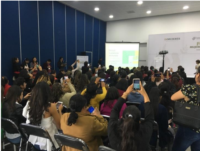
Fotografía 4. Ponencia magistral