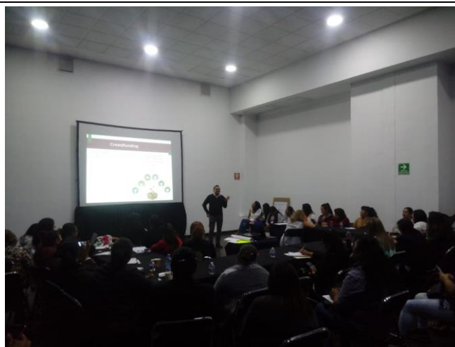
Fotografía 16. Salón 4 explicación Crowdfunding